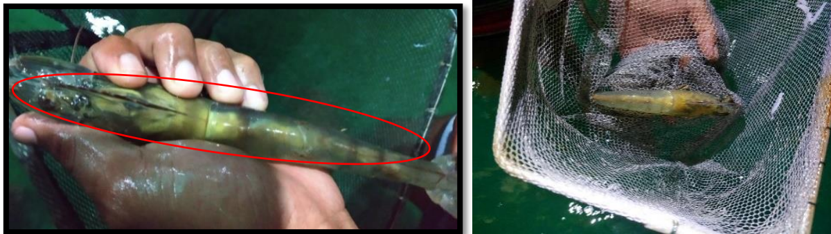
Gambar 1 Induk matang gonad

Induk yang telah matang telur dan sudah siap untuk dipijahkan ditandai dengan perkembangan ovary pada bagian dorsal tubuh udang berwarna orange dan terlihat semakin jelas, membentuk garis tebal dan menggelembung ke arah kepala. Induk yang sudah matang gonad dapat dilihat pada Gambar 1.