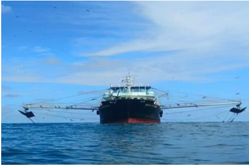
Gambar 2. Kapal Binama 07 Jakarta

Waktu tempuh ke fishing ground sekitar tiga hari, dan kegiatan penangkapan berlangsung selama 21 hari.