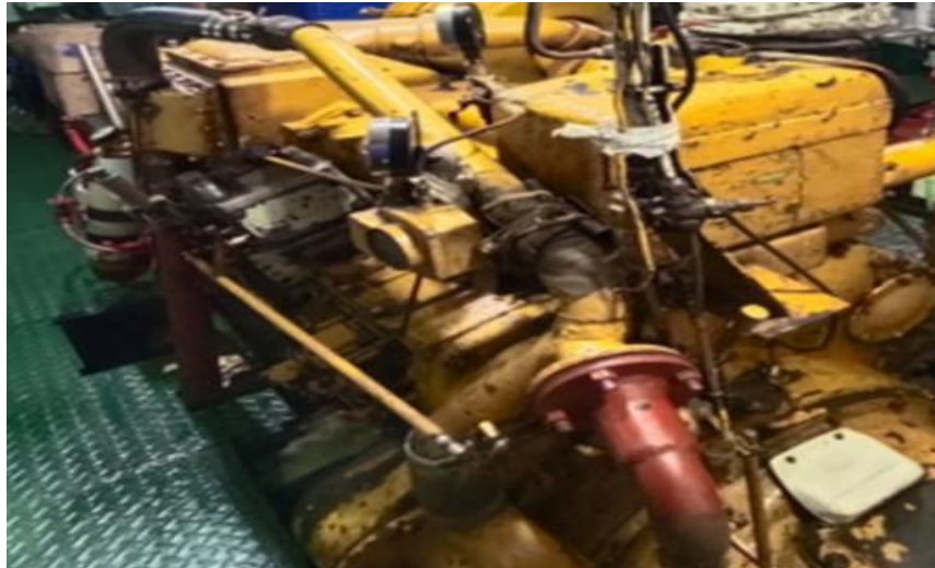
Gambar 3. Mesin Induk Binama 07 Jakarta