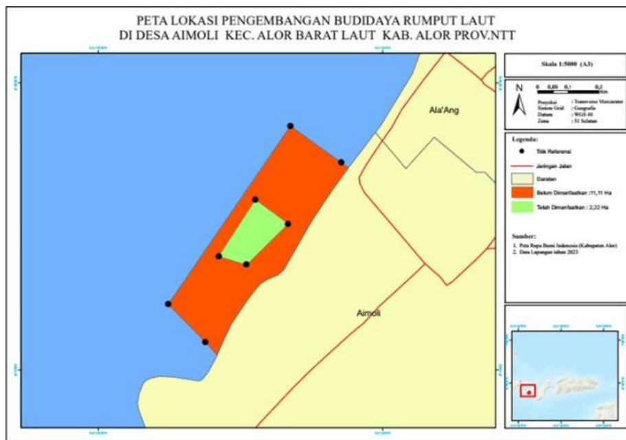
Gambar 3. Peta Kawasan Budidaya Rumpu Laut Desa Aimoli yang sudah di dimanfaatkan (hijau) dan belum di dimanfaatkan (merah)

dimanfaatkan sebagai pengembangan lahan budidaya rumput laut baru seluas 2,22 ha atau 19,98% ha. Jika lahan budidaya Rumpu laut ini dapat dimanfaatkan secara maksimal tentu saja dengan memenuhi aspek, ketersediaan biaya, ketersediaan fasilitas pembudidayaan dan keberadaan sumberdaya manusia (pembudidaya) sesuai dengan pernyataan (Dewi & Saraswati, 2016).