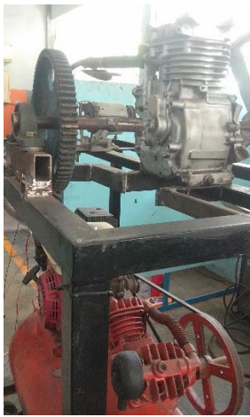
Gambar 1. Alat Uji Mesin Berpenggerak Udara

Sedangkan alat-alat yang digunakan pada saat pengujian diantaranya adalah: